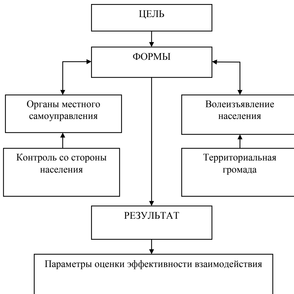
Рис. 4 – Структурно-функциональная модель взаимодействия органов местного самоуправления и населения

Предложено изменить существовавшее ранее практики централизованного решения кадровых вопросов, что повысит ответственность работников местного самоуправления, их инициативность в соответствии со стандартами, существующими в развитых странах, ускорит осуществление мероприятий по децентрализации власти.