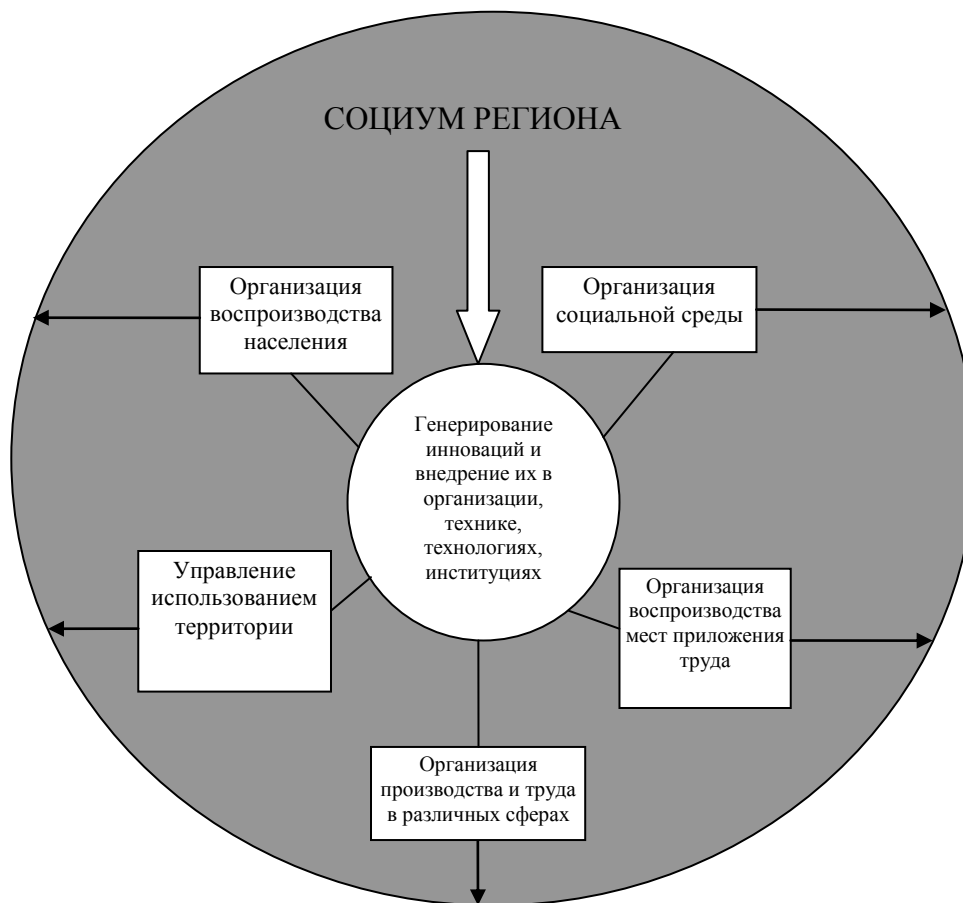
Рис. 1 – Схема пространственной организации социума региона

Установлено, что пространственная организация населения сводится к созданию эффективного механизма ее реализации в процессе активной социально-экономической деятельности населения (рис. 1).